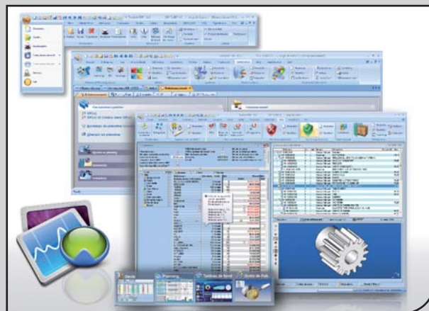
L'ergonomie hors du commun de TopSolid'Erp réduit fortement les temps de manipulation pour traiter et consulter les informations