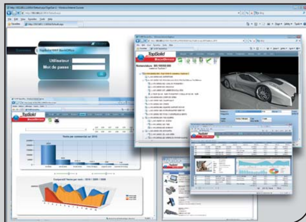
TopSolid'Erp BackOffice pour améliorer les relations commerciales